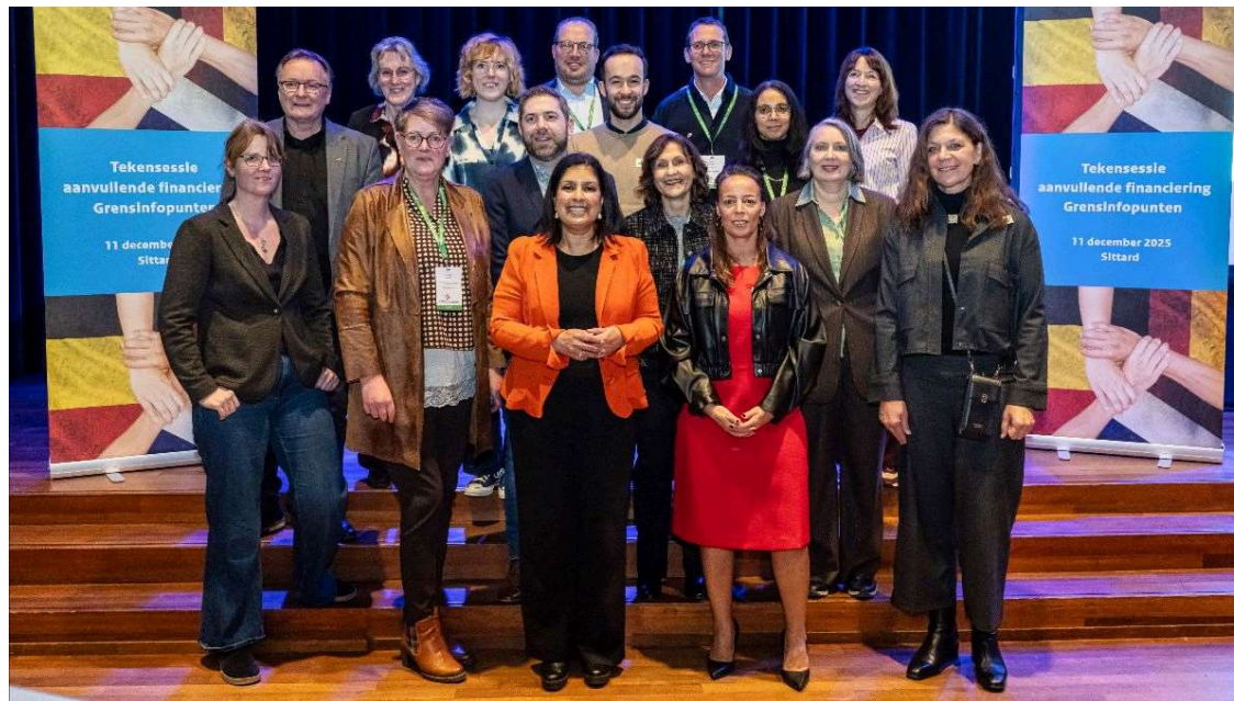
Ondertekening aangepast convenant voor de GrensInfoPunten op Grenslandconferentie